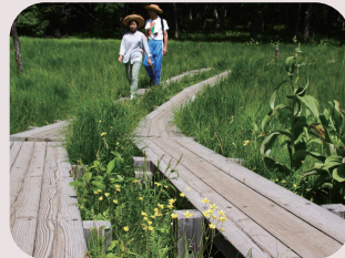
戦場ヶ原 車で 10 分