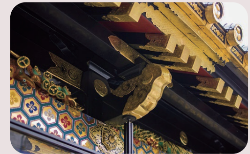
日光東照宮 車で 30 分