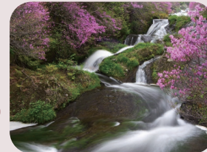
竜頭ノ滝 車で 10 分