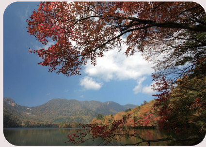
湯の湖 徒歩 5 分