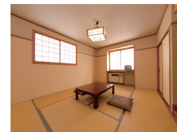
ガーデンハウス 和室