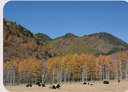
光徳牧場 車で 10 分