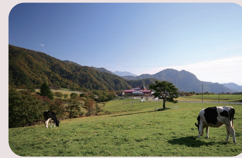
大笹牧場 車で 70 分