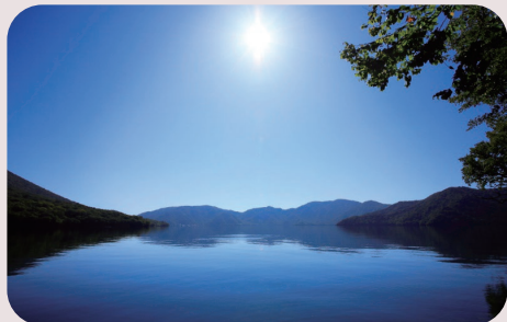
中禅寺湖 車で 20 分