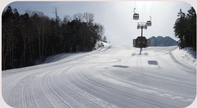
丸沼高原スキー場 徒歩 10 分